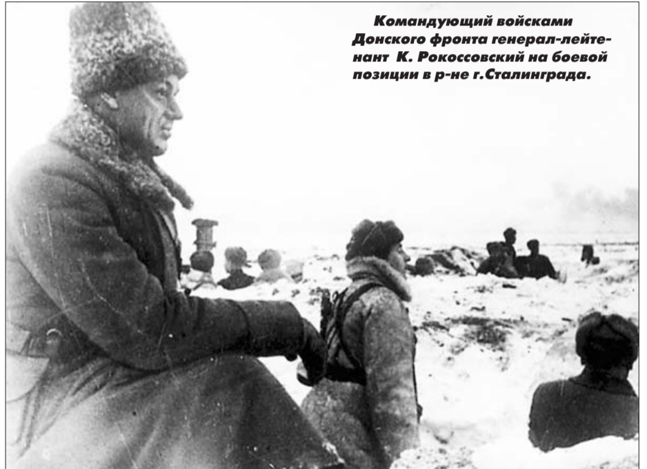
Командующий войсками Донского фронта генерал-лейтенант К. Рокоссовский на боевой позиции в р-не г. Сталинграда.

живших... Командующий фронтом лично проверял выполнение своих указаний. Вспоминая те дни, маршал войск связи Иван Пересыпкин писал: "Бывая часто с Рокоссовским в штабе фронта, а также в войсках, я имел возможность наблюдать, как он руководил войсками и работал. Безусловно, это был выдающийся человек, полководческий талант и богатые дарования которого еще больше раскрылись в последующем ходе Великой Отечественной войны".